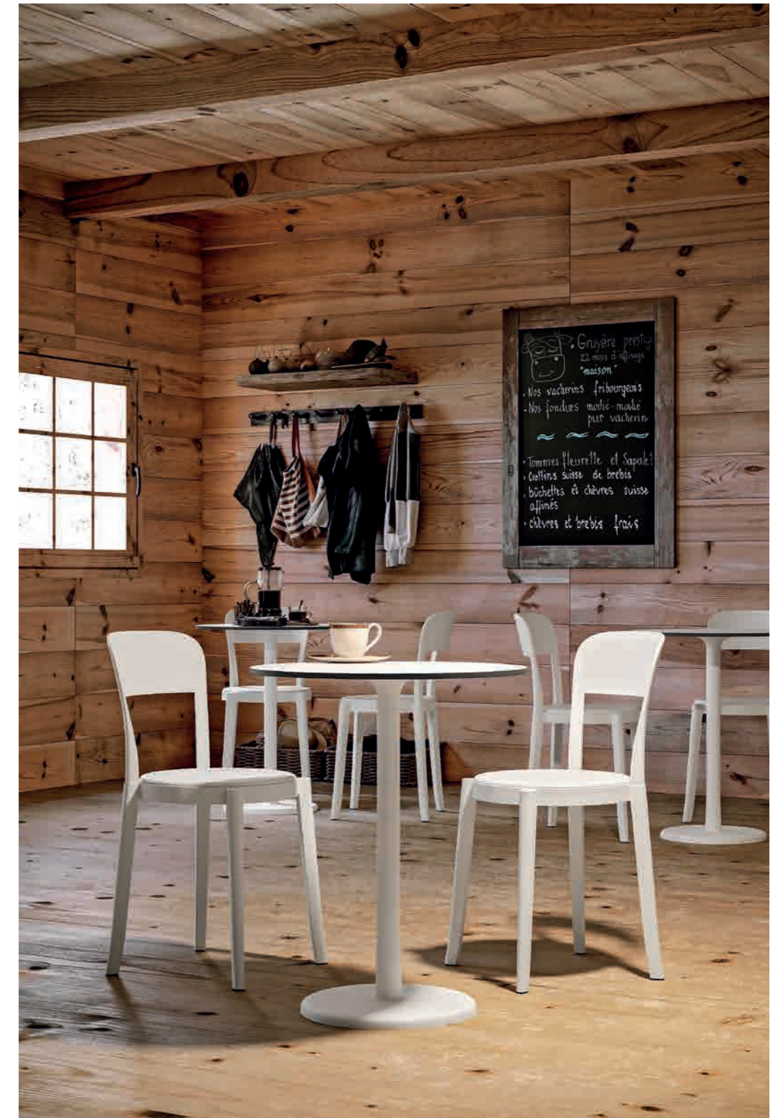
Chalet ristorante - TORRE in bianco - ALFIERE Basso in bianco / bianco