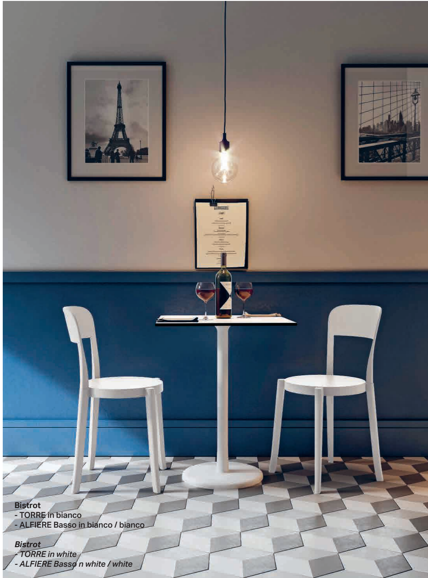
Bistrot - TORRE in bianco - ALFIERE Basso in bianco / bianco