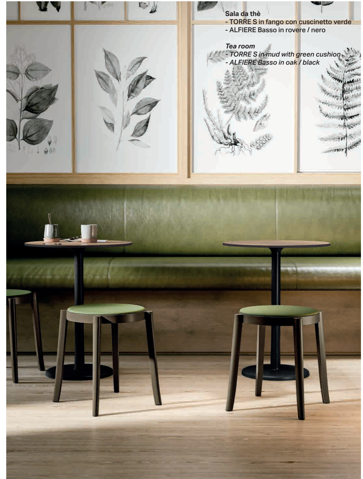
Sala da thè - TORRE S in fango con cuscinetto verde - ALFIERE Basso in rovere / nero