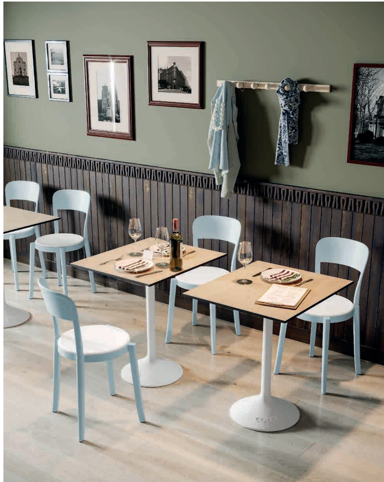
Bistrot - TORRE in celeste con cuscinetto bianco - STATO Basso in rovere / bianco