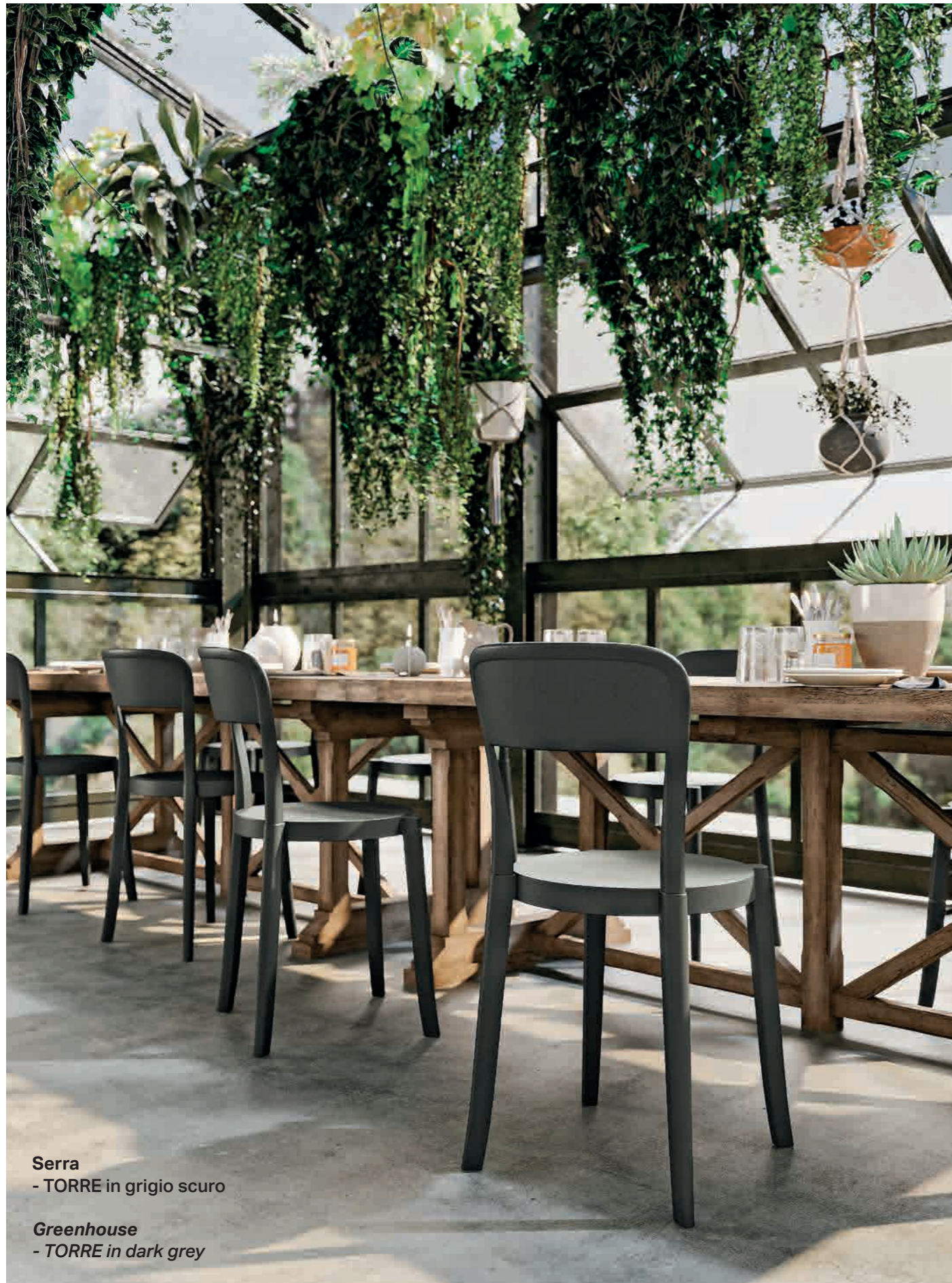
Serra - TORRE in grigio scuro