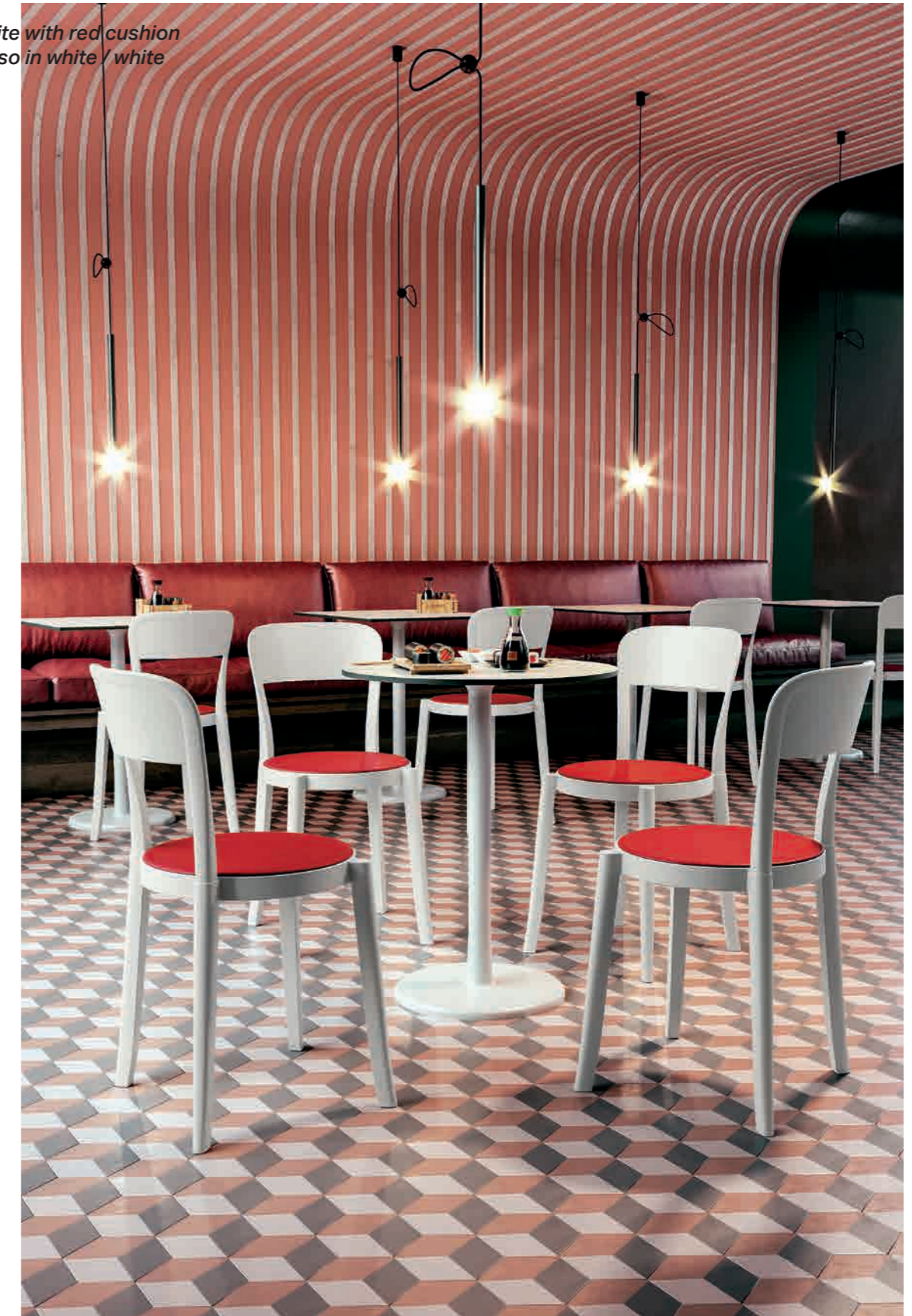
Restaurant - TORRE in white with red cushion - ALFIERE Basso in white / white